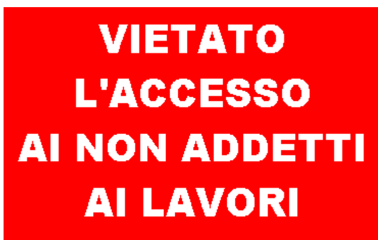
Vietato l'accesso ai non addetti ai lavori