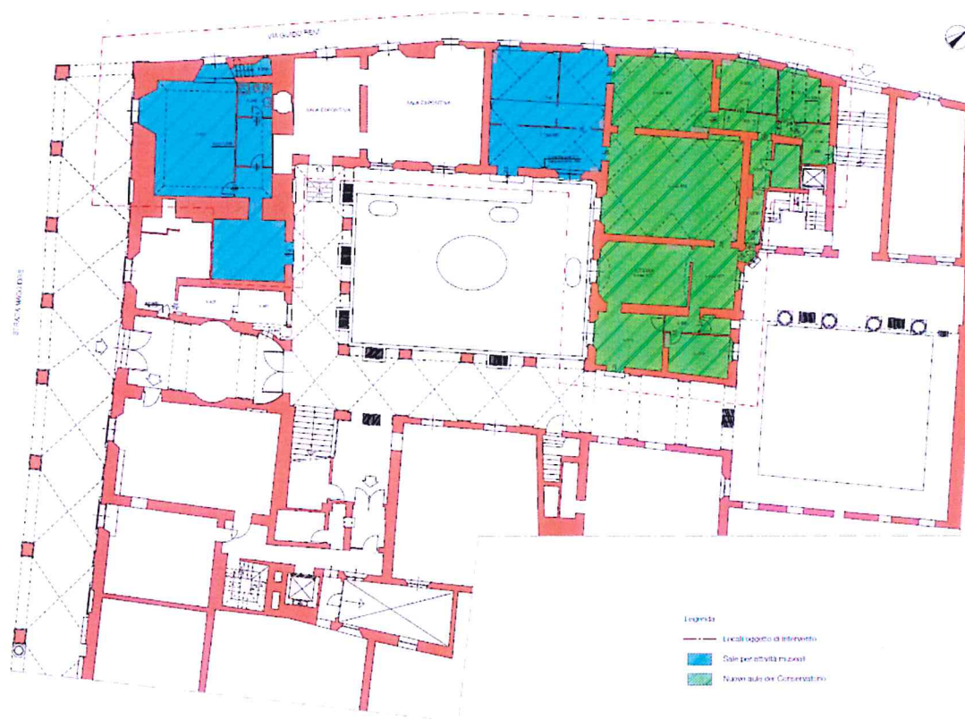
Planimetria Piano Terra – Stato di fatto (in verde i locali da destinare al Conservatorio - in azzurro quelli da destinare ad attività museali)

L'elenco degli interventi è da considerarsi descrittivo e non esaustivo, rimandando alla fase progettuale la localizzazione e tipologia degli interventi.