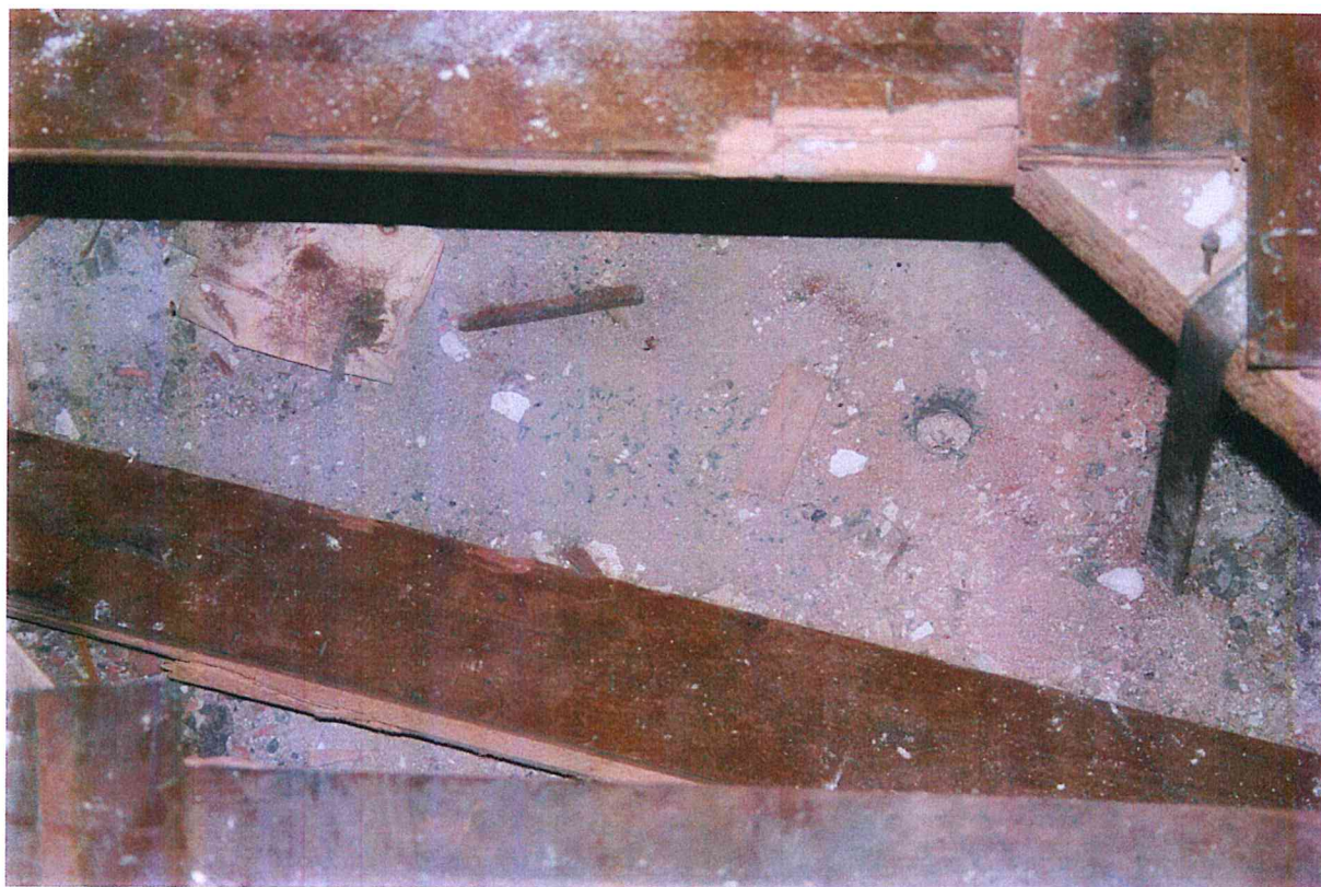
Particolare degrado pavimento sopraelevato

Dipartimento Lavori Pubblici, Mobilità e Patrimonio Settore Manutenzione U.I. Edilizia