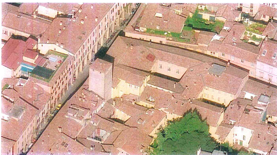
Museo della Musica – Vista dall'alto

Sono ammessi i seguenti tipi di intervento: manutenzione ordinaria, manutenzione straordinaria, risanamento conservativo e ristrutturazione edilizia nei limiti definiti dall'art. 25, comma 2 del RUE.